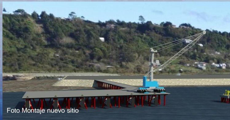
Foto Montaje nuevo sitio