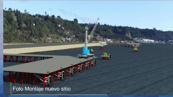
Foto Montaje nuevo sitio