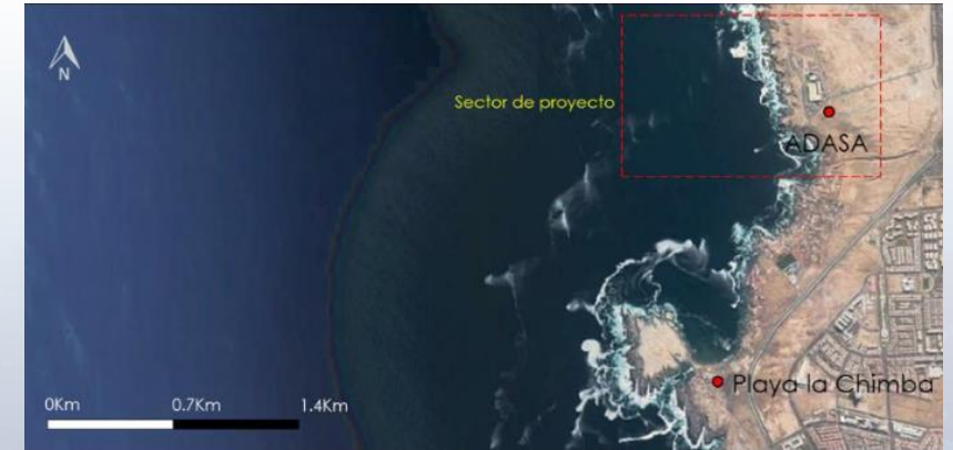
Ubicación del proyecto.