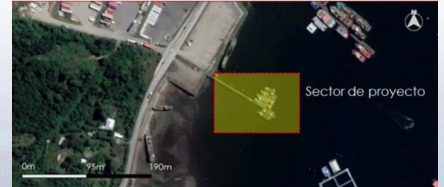
Ubicación del proyecto